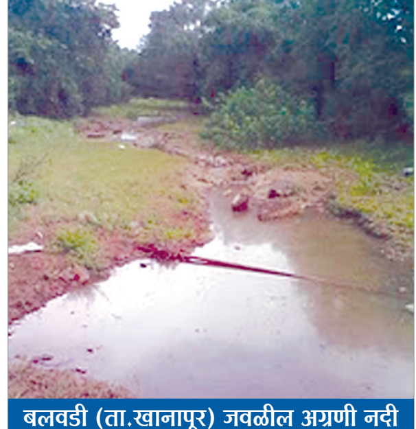
बलवडी (ता. खानापूर) जवळील अग्रणी नदी

पासून ५ किलोमीटरचा बोगदा काढून अग्रणी नदीला वायफळे गावाच्या अलीकडे यमगरवाडी रस्त्याजवळ (ता. तासगाव) अग्रणीला पाणी देता येईल. एकूण ४ मीटरच्या नैसर्गिक उताराने नेलकरंजीहून बोगद्याद्वारे अग्रणीला पाणी मिळेल. ही अग्रणी नदी तासगाव आणि कवठेमहाकाळ पासून पुढे कर्नाटकातील खिळेवाडी (जि. बेळगाव) च्या पलिकडे जावून कृष्णा नदीला मिळते. अशा रितीने माणगंगा, येरळा आणि अग्रणी तिन्ही नद्यांना पाणी मिळणार आहे.