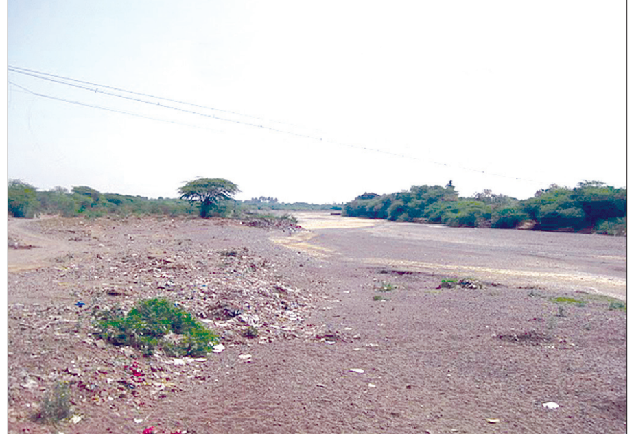
दिवंची (ता. आटपाडी) : माणगंगा नदीचे सध्याचे चित्र!