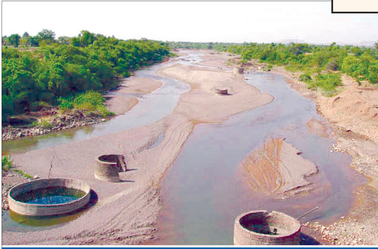
नेवरी (ता.कडेगाव)जवळील येरळा नदीचे प्रातिनिधीक चित्र..!

माणगंगा ही भीमानदीची उपनदी असली तरी भीमा ही कृष्णेची उपनदी आहे. त्यामुळे माणगंगेसह अग्रणी आणि येरळा या तिन्ही नद्या कृष्णा नदीच्या खोऱ्यात येतात. कृष्णा लवादाच्या वाटपा अतिरिक्त पावसाळ्यातील ४.५२ टी.एम. सी. पाणी कृष्णा नदीत उपलब्ध आहे. कोयना पाणलोट क्षेत्रात सोळशी नदीवर धनगरवाडी गावाजवळ वळण बंधारा बांधून ते पाणी धोम धरणात आणि तेथून उताराने थेट दुष्काळी भागाकडे आणण्यात येणार आहे.